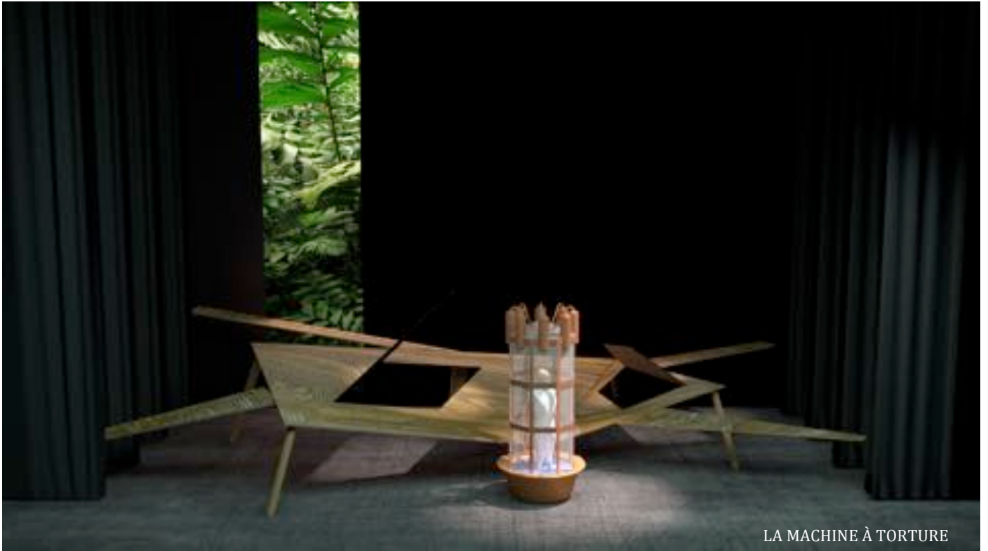
LA MACHINE À TORTURE