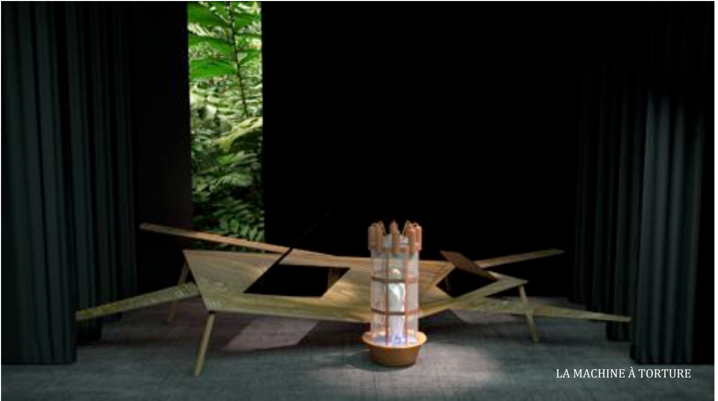
LA MACHINE À TORTURE