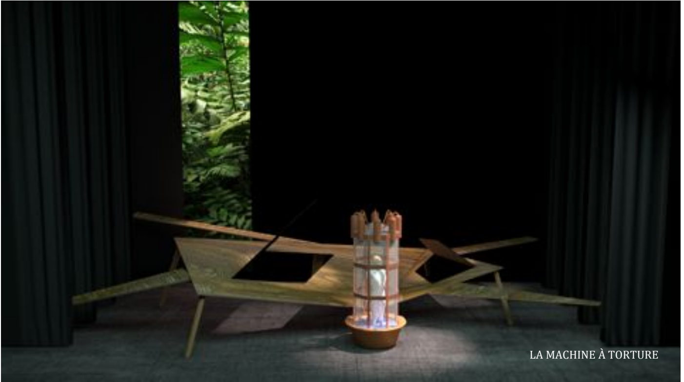
LA MACHINE À TORTURE