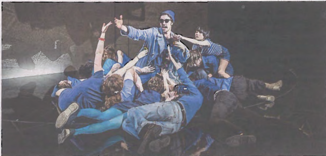
Les quatorze comédiens de « Mathias et la révolution » avaient intégré l'École du Nord en 2012.

LILLE. Dernier rendez-vous au Théâtre du Nord, avec le spectacle de sortie de la quatrième promotion de l'École du Nord. Quatorze « jeunes pousses » qu'il faudra suivre dans l'avenir.