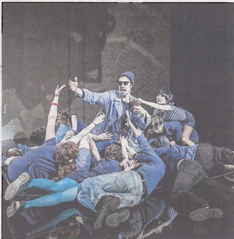
Les quatorze comédiens de « Mathias et la révolution » avaient intégré l'École du Nord en 2012.

Deux heures durant, les quatorze comédiens se livrent à un exercice de haute voltige, à la fois excitant – le croisement et le heurt des époques sur le thème de la Révolution, ses répliques hier et aujourd'hui, et ses corollaires, émeutes et violences, rumeurs, rêves, utop-