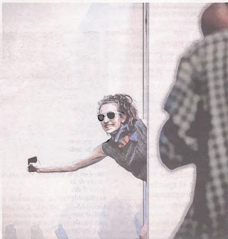
Séance de répétition à Lille il y a quelques jours.